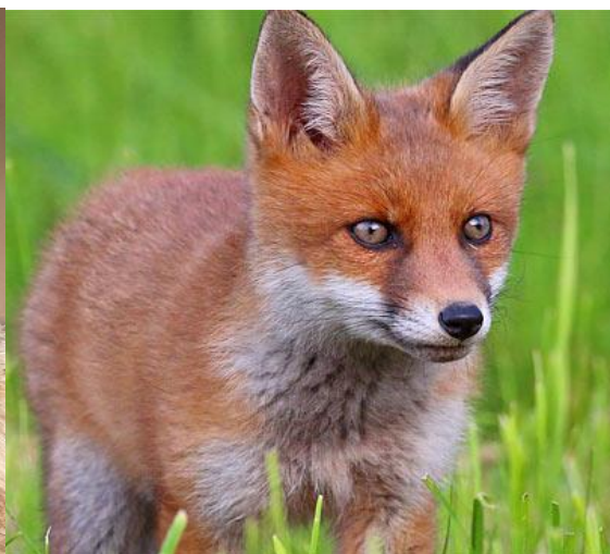
Fuchs, Foto NABU, Frank Derer