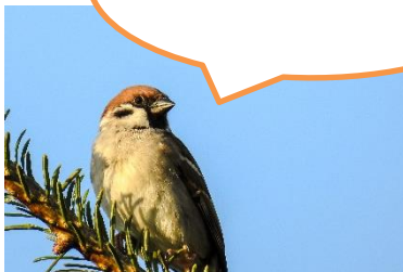
Abbildung 8: Kathy Büscher, NABU Rinteln