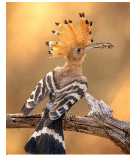
Abbildung 1: NABU/CEWE/Fotograf*in

Das Aussehen des Wiedehopfs ist auffällig durch die orangen braunen Elemente an Brust und Kopf. Die Flügel und der Schwanz sind auffällig schwarz-weiß gemustert, der Schnabel lang und gebogen und der Wiedehopf kann seine Federhaube aufstellen. Beide Geschlechter sehen gleich aus. Er kommt in weiten Teilen Europas vor, ist wärmeliebend, ein Langstreckenzieher (überwintert südlich der Sahara) und lebt im Offenland (Parks, Gärten, Weinberge, Olivenhaine, usw.). Die Nahrung des Wiedehopfs besteht v.a. aus großen Insekten, deren Larven und auch kleinen Wirbeltieren (Eidechsen, Geckos, usw.). Er sucht Nahrung am Boden und füttert seine Jungvögel mit Insekten und anderen Wirbellosen. Die Brutzeit geht von Anfang April bis Anfang Juli mit 1 bis 2 Jahresbruten. Bei dem Wiedehopf handelt es sich um einen Höhlenbrüter. Trotz wieder ansteigender Zahlen ist der Bestand immer noch gefährdet. Die größte Gefahr ist der Lebensraumverlust (z. B. Rückgang extensiver Wiesen und Weiden durch intensive Landwirtschaft), der Nahrungsmangel (weniger Großinsekten durch z. B. Pestizideinsatz) und der Mangel an Nistplätzen (z. B. wenige alte Obstbäume mit Höhlen).