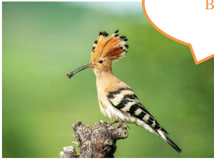
Abbildung 7: NABU/CEWE/Christian Gunkel