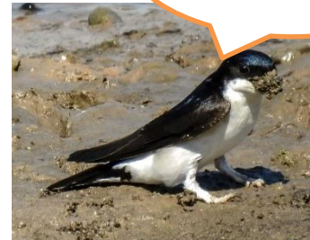
Abbildung 10: Katy Büscher, NABU Rinteln