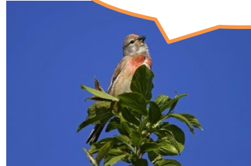
Abbildung 6: Marcus Bosch