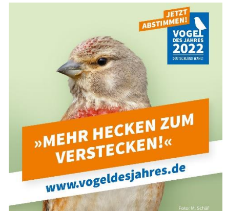
Abbildung 12: NABU/M. Schäf