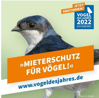
Abbildung 11: NABU/M. Schäf

Die Wahl findet bis zum 18. November auf der Website: https://www.vogeldesjahres.de statt. Hier kann man auch noch Videos zu den Kandidaten anschauen und den „Bird-O-Mat“ machen. Schaut doch mal auf der Website vorbei.