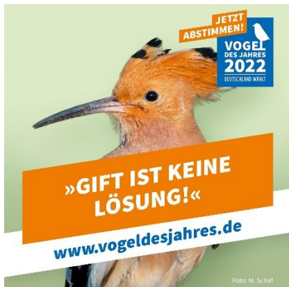
Abbildung 15: NABU/M. Schäf