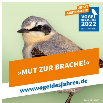
Abbildung 13: NABU/M. Schäf