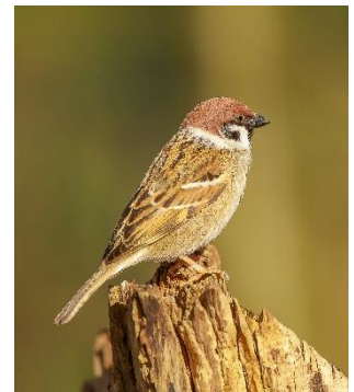
Abbildung 4: NABU/Winfried Rusch

Feldsperlinge haben einen braunen Scheitel, einen schwarzen Schnabel, einen schwarz-braun gestreiften Rücken, weiße Kopfseiten mit schwarzen Wangen- und Kinnfleck und eine helle Flügelbinde. Sie kommen in weiten Teilen Europas und Asiens vor, leben im Offenland (v.a. Agrarlandschaft mit Hecken und Bäumen, Waldränder und Lichtungen und Parks/ Gärten im Siedlungsraum – also alles mit viel Gehölz). Bei den Feldsperlingen handelt es sich um Standvögel, wobei Teile der asiatischen Population eine Ausnahme darstellen. Sie fressen v.a. Samen, Gräser, Getreide, Wildkräuter und auch tierische Kost. Die Jungvögel werden mit Insekten und Larven gefüttert. Die Brutsaison ist von Ende März bis Anfang Juni mit 1 bis 3 Jahresbruten. Der Nestbau ist v.a. in Baumhöhlen, Nistkästen und an Gebäuden und erfolgt durch Männchen und Weibchen, sowie auch die Brut und die Fütterung. Die größte Gefahr stellt die intensive Landwirtschaft dar. Durch den Einsatz von Pestiziden geht Nahrung verloren und der Anbau von Winterkulturen verringert die Anzahl an Stoppelfeldern im Winter.