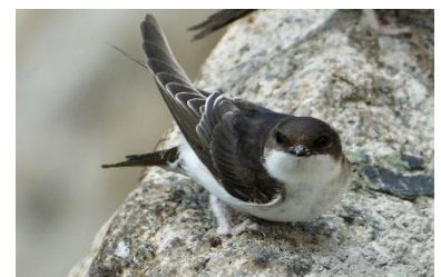
Abbildung 5: NABU/CEWE/Carsten Friedrich

Das Aussehen der Mehlschwalbe ist durch eine schwarz-blau glänzende Oberseite und einer weißen Unterseite gekennzeichnet. Der Schwanz ist leicht gegabelt und die Augen, sowie der Schnabel sind schwarz. Sie kommen in Europa und weiten Teilen Nordasiens vor und leben vor allen in Siedlungsräumen, wo sie ihre Brut an Bauwerken oder Küsten abhalten. Die Nahrungssuche ist im Offenland und häufig an Gewässern. Sie ernähren sich fast ausschließlich von Fluginsekten in über 20m Höhe. Jungvögel werden ebenfalls mit Insekten gefüttert. Manchmal jagen sie auch in Schwärmen, bis zu 2km Entfernung vom Nest. Bei den Mehlschwalben handelt es sich um Langstreckenzieher. Mit 1 bis 2 Jahresbruten ist die Brutsaison von Mitte Juni bis Mitte August. Mehlschwalben sind Gebäudebrüter und die Nester sind aus Lehm/Erde an rauen Oberflächen unter Vorsprüngen gebaut. Die größte Gefahr stellt die z.T. illegale Beseitigung von Nestern und der Insektenrückgang dar. Durch Versiegelung werden geeignete Stellen zum Sammeln von Nestmaterial (offene, feuchte Stellen mit lehmigen Böden) immer seltener.