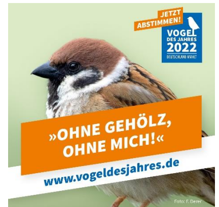
Abbildung 14: NABU/M. Schäf

Wir alle freuen uns auf einen spannenden Wahlkampf und einen tollen Jahresvogel 2022 zu dem wir dann gemeinsam viele Naturschutzaktionen anbieten und durchführen können.