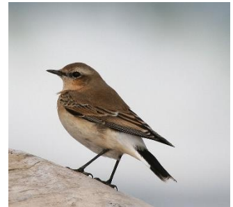
Abbildung 3: Wolfgang Patczowsky

Der Steinschmätzer hat eine charakteristische schwarz-weiße Schwanzmusterung. Die Männchen haben eine schwarze Maske mit weißen Überaugenstreif, schwarze Flügel und eine gelbliche Kehle. Weibchen hingegen haben braune Flügel, einen grau-braunen Rücken und kein schwarz am Kopf. Sie leben in steinigem Offenland (z.B. Wiesen, Weide, Strand- und Küstenwiesen, Berghänge, sowie Heide- und Abbaugelände). Sie sind Langstreckenzieher und überwintern südlich der Sahara. Steinschmätzer ernähren sich von Insekten, Larven und selten auch von Beeren. Die Suche findet vor allem an offenem Boden oder am Boden in kurzer Vegetation statt. Die Brutsaison ist von Anfang Mai bis Ende Juni mit 1 bis 2 Jahresbruten und der Nestbau ist in Spalten und Höhlen (bodennah in Steinhaufen, Mauern usw.). Gefährdet sind Steinschmätzer vor allem durch Lebensraumverlust (z.B. Nährstoffüberfrachtung in der Landschaft lässt vegetationsarme Lebensräume schrumpfen, weniger Weiden, „Aufräumen“ bzw. Entfernen von Steinen und Felsen von Wiesen und Weiden).